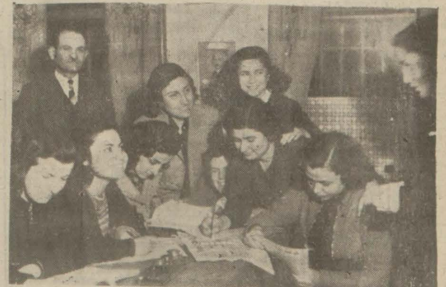
Toros Kız Talebe Yurduunun bir kısım talebesi ve idarecileri müdür odasında

[Bir arkadaşımız, Partinin yeni bir Talebe Yurdu yaptırmak yolundaki teşebbüsü üzerine. İstanbulda mevcut resmî, hususî bütün Talebe Yurdlarını birer birer dolaşı, eskaklerini, ihtiyaçlarını, gençlerin neler istediklerini tesbit etti, bugünden itibaren bunları «Son Posta» da si bütün Talebe Yurdlarını birer