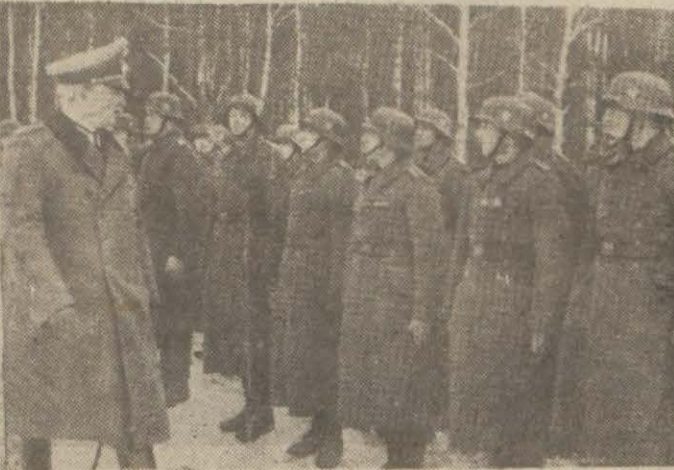
Sark cephesinde Almanlarla yanyana harbeden Fransız gönüllüler: Bir Alman generelinin gönüllü kuvvetleri teftişi ve bu merasime iştirak eden Fransız lejyonunun bayrağı